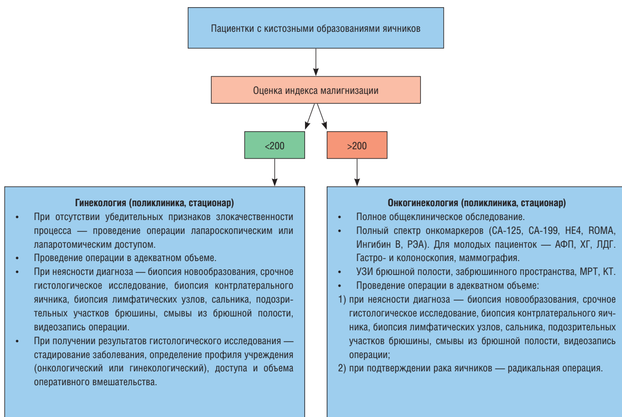
Рис. 2. Медико-организационные аспекты ведения пациенток с кистозными образованиями яичников с использованием индекса малигнизации.

разованиями яичников. Дифференцированный подход в зависимости от показателя индекса позволяет оптимизировать медико-организационные аспекты ведения таких больных, своевременно изменив тактику и направив пациентку в профильное учреждение. Медико-организационные аспекты представлены на рис. 2.