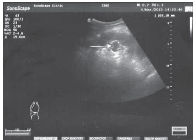
Рис. 2. Пиелоэктазия слева.