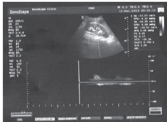
Рис. 4. Показатели почечной гемодинамики при нормализации размеров собирательной системы.

контуры почек ровные, четкие, толщина паренхимы 13–14 мм с обеих сторон, чашечки 5–6 мм, лоханки с обеих сторон 7–9 мм. Больная была прооперирована: выполнена лапаротомия, абдоминализация поджелудочной железы, некрсеквестрэктомия, марсупиализация сальниковой сумки, дренирование сальниковой сумки, забрюшинного пространства и брюшной полости. На 4-е сут после операции состояние пациентки ухудшилось: зарегистрирована стойкая гипертермия, при ультразвуковом исследовании обнаружены ограниченные жидкостные зоны в парапанкреатической клетчатке в области хвоста поджелудочной железы, в паранефрии с обеих сторон. При ультразвуковом сканировании почек выявлена умеренная двусторонняя каликопиелоэктазия. При ультразвуковой доплерографии междолевых артерий справа и слева: RI 0,66 и 0,64, соответственно. Выполнена релапаротомия, некрсеквестрэктомия, редренирование брюшной полости и забрюшинного пространства. При динамическом ультразвуковом контроле отмечалась положительная динамика: жидкостные зоны в забрюшинном пространстве уменьшились вплоть до исчезновения, в левой плевральной полости — свободная жидкость до 15–20 мл, в почках — чашечно-лоханочная система в пределах нормы. RI в междолевых артериях справа и слева — 0,63 и 0,62, соответственно.