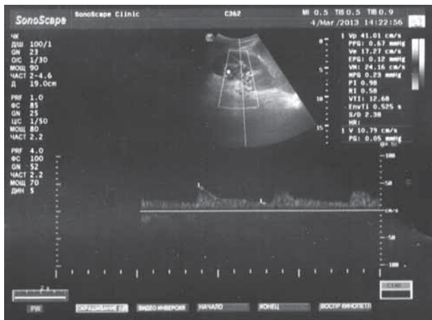
Рис. 3. Показатели почечной гемодинамики (левая почечная артерия) при пиелоэктазии.