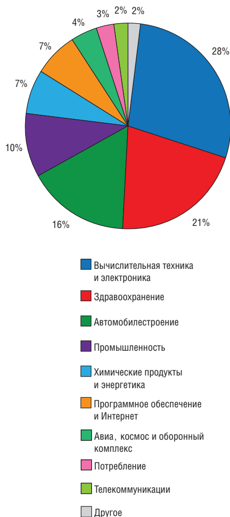
Рис. 2. Распределение затрат 1000 передовых инновационных компаний мира на R&D по отраслям производства в 2011 г. (Источник: The Global Innovation 1000; 2012).

Отмечая несопоставимость объемов инвестиции в исследовательские проекты отечественных и зарубежных компаний, следует упомянуть и о том важном обстоятельстве, что даже незначительные по сравнению с зарубежными корпоративные средства на НИОКР в РФ имеют тенденцию к снижению, в то время как зарубежные компании из года в год увеличивают объемы средств на технологические разработки. Так, согласно выполненному агентством «Ремедиум» анализу инвестиционной активности предприятий отрасли (по данным квартальной государственной статистической отчетности формы № П-2 «Сведения об инвестициях в нефинансовые активы»), затраты отечественных компаний фармацевтической отрасли на объекты интеллектуальной собственности, НИОКР и технологические работы в первом полугодии 2013 г. снизились по сравнению с соответствующим периодом предыдущего года в 8,23 раза [16].